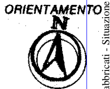
PIANTA PIANO PRIMO H=m 2.70